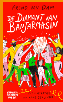
KINDERBOEKENWEEK GESCHENK Geschreven door Arend van Dam

Dit keer is het thema 'En toen?' en gaan we terug in de tijd. Boeken brengen geschiedenis tot leven, waardoor de wereld van vroeger tastbaar wordt. We lezen spannende verhalen over ridders, verplaatsen ons in de oorlogstijd of komen van alles te weten over de Oudheid. Op school gaan we er een mooie Boekenweek van maken vol leesplezier!